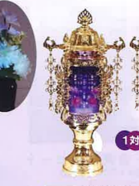
MK-3 アクアゴールド パープルLED 一般価格▶22,000円(税込)