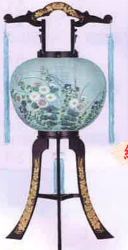
O-23 回転 名月 一般価格▶10,450円(税込)

会員価格 10,000円(税込) ●高さ80cm×φ32cm ●プラスチック製 ●菊桔梗