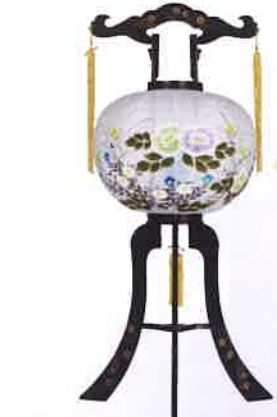
O-17 回転 大輪13号 一般価格▶19,800円(税込)

会員価格 17,500円(税込) ●高さ98cm×φ40cm ●プラスチック製 ●牡丹