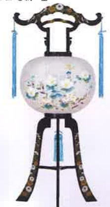
O-18 回転 石谷 一般価格▶13,200円(税込)

会員価格 17,500円(税込) ●高さ98cm×φ40cm ●プラスチック製 ●牡丹