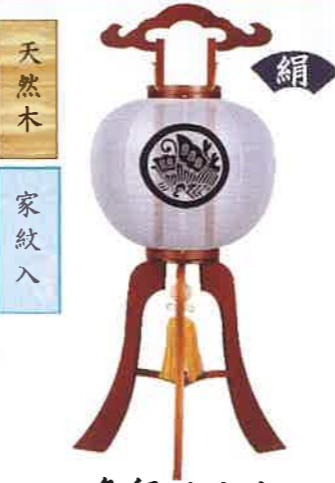
O-16 亀印 ケヤキ 一般価格▶36,300円(税込)

会員価格 36,000円(税込) ●高さ83cm×φ34cm ●紋二重 ●萩桔梗 ●黒壇突板材