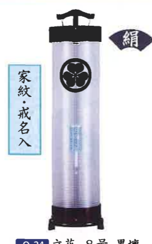
O-24 立花 8号 黒壇 一般価格▶47,080円(税込)

会員価格 9,000円(税込) ●高さ79cm×φ32cm ●プラスチック製 ●菊桔梗