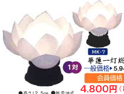
MK-7 華蓮一灯総白LED 一般価格▶5,940円(税込)