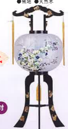
O-20 かみじま 黒(1個入) 一般価格▶15,730円(税込)

会員価格 21,000円(税込) ●高さ88cm×φ34cm ●プラスチック製 ●菊桔梗