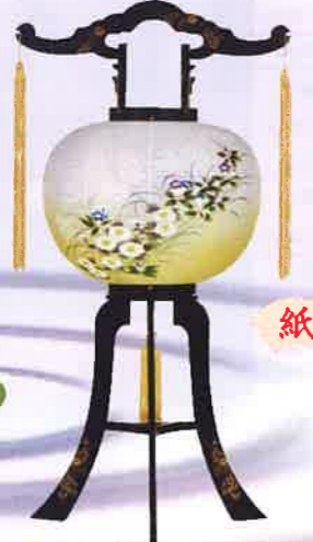
O-21 回転 高清水 一般価格▶13,200円(税込)

会員価格 13,000円(税込) ●高さ124cm×φ40cm ●プラスチック製