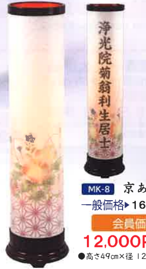
MK-8 京あかり想い 一般価格▶16,500円(税込)