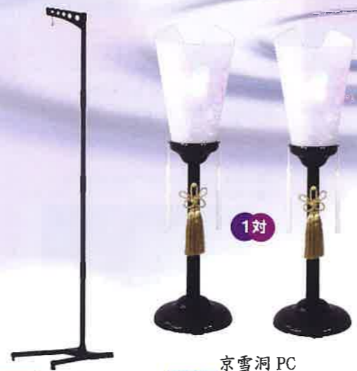
O-29 PC提灯スタンド 200 一般価格▶7,975円(税込)