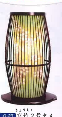
O-27 京竹2号タメ 一般価格▶19,140円(税込)