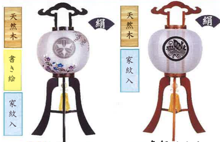
O-15 亀印 黒壇 一般価格▶46,200円(税込)

会員価格 68,000円(税込) ●高さ83cm×φ34cm ●紋二重 ●花あしらい