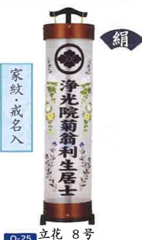
O-25 立花 8号 ケヤキ調 一般価格▶56,980円(税込)

会員価格 39,500円(税込) ●高さ103cm×φ27cm ●黒壇突板材・木製