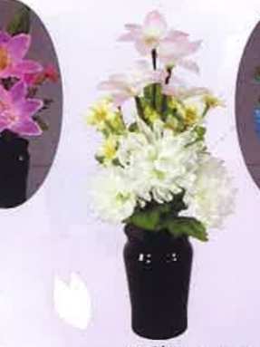
MK-2 小型ルミナス菊 LEDコードレス 一般価格▶9,240円(税込)