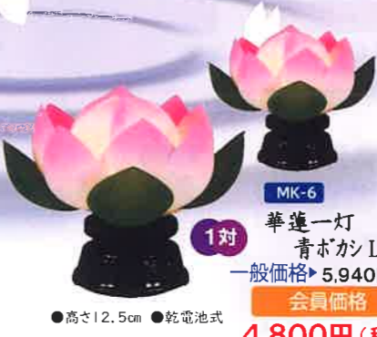
MK-6 華蓮一灯 青ボカシLED 一般価格▶5,940円(税込)