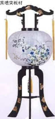
O-19 回転 花風(対柄) 一般価格▶26,950円(税込)

会員価格 12,000円(税込) ●高さ95cm×φ37cm ●プラスチック製 ●芙蓉