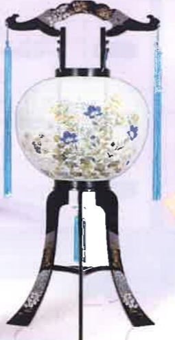
O-22 回転 こもれび 一般価格▶12,100円(税込)

会員価格 11,000円(税込) ●高さ84cm×φ34cm ●プラスチック製 ●菊にリンドウ