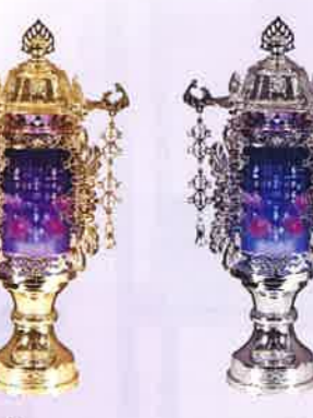
MK-4 アクアプラチナ ブルーLED 一般価格▶22,000円(税込)