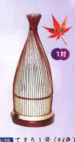
O-28 てまり1号(夕メ色) 一般価格▶13,200円(税込)