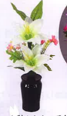
MK-1 小型ルミナス百合 LEDコードレス 一般価格▶8,800円(税込)