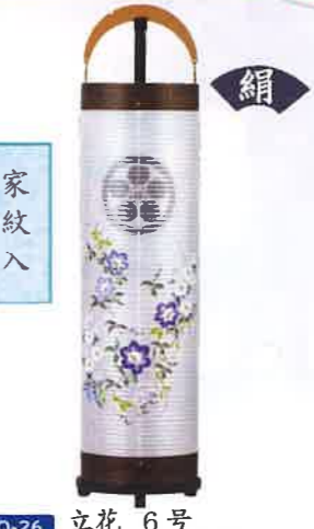
O-26 立花 6号 神代調 一般価格▶42,680円(税込)